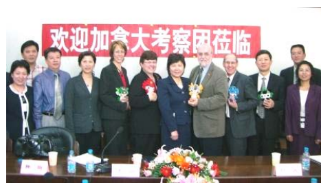
加拿大考察团访问北京朝阳区司法局。

的工作不仅为创造安全社区提供专业知识，而且我们的知识和经验与世界各地象我们一样工作的专家紧紧相连。大家共同努力，我们的成就将是无限的。