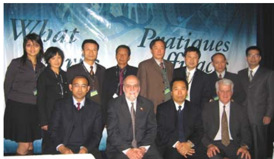
中国监狱学会代表参加2006工作方案交流会。

大会由公共安全部部长 Stockwell Day 致开幕词, 由前任司法部长 Vic Toews 致闭幕词。很多联邦部门的代表参加了大会。目前加拿大政府强调打击犯罪, 所以他们对这种大会所表示的支持也是很自然的。