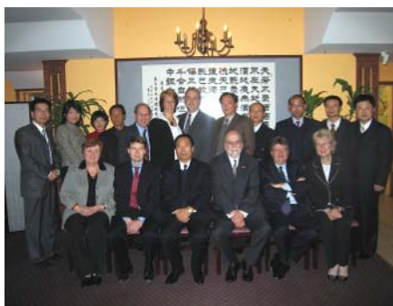
中国监狱学会代表与加拿大司法界代表在渥太华会晤。