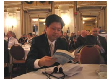
中国监狱学会代表在“2006 工作方案交流会”上审阅一本加拿大刑事学教科书。

除了得到政界的支持, 会议也带来了两大信息。第一是加拿大矫正局在收集、分享监管犯资料方面的工作受到各省同行、法