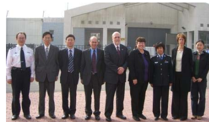
加拿大考察团参观北京一所监狱。

在过去的 18 个月内，我已经参加过三次前往中国的访问，与此同时也与来自中国监狱学会的四个代表团进行直接交流。这些互访带来了各个代表团众多参与者之间的相互尊重，因为他们都是正在争取对罪犯的人道待遇以及让社区更加安全。作为国际中心矫正项目主任，我要向来自中国监狱学会的众多代表表示衷心的感谢，他们为我们双方支持的中加矫正项目的成功作出了莫大贡献。我同时还要衷心感谢加拿大国际发展署和加拿大矫正局的一贯支持。我们希望《矫正工作通讯》将有助于进一步加强双方在未来的相互尊重与合作。